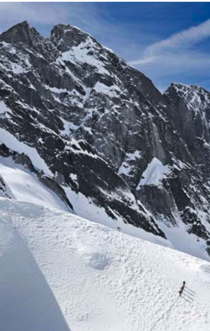
Zwei Täler westlich vom Val Forno auf dem Weg zur Cima della Bondasca erreicht man bald den wilden Bondasca- kessel, im Hintergrund der Pizzo Badile.