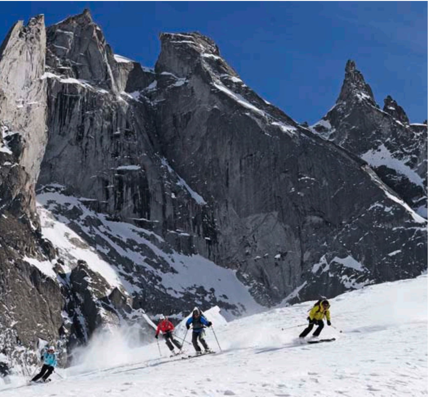
Das Beste liegt für einmal im Rücken: Abfahrt bei nicht ganz optimalen Schneeverhältnissen vor der mächtigen Kulisse der Scioragruppe mit Sciora Dafora, Punta Pioda und Ago di Sciora (v.l.n.r.).

Passo Sissone–P. 3268 (Vorgipfel, Skidepot)–Monte Sissone. Die Tour kann gut mit der Cima di Rosso kombiniert werden: zusätzlich 1 Std. Unterhalb Passo Sissone Richtung N unterhalb Gipfelfelsen (Skidepot), über Firnfeld auf Westgrat–Cima di Rosso.