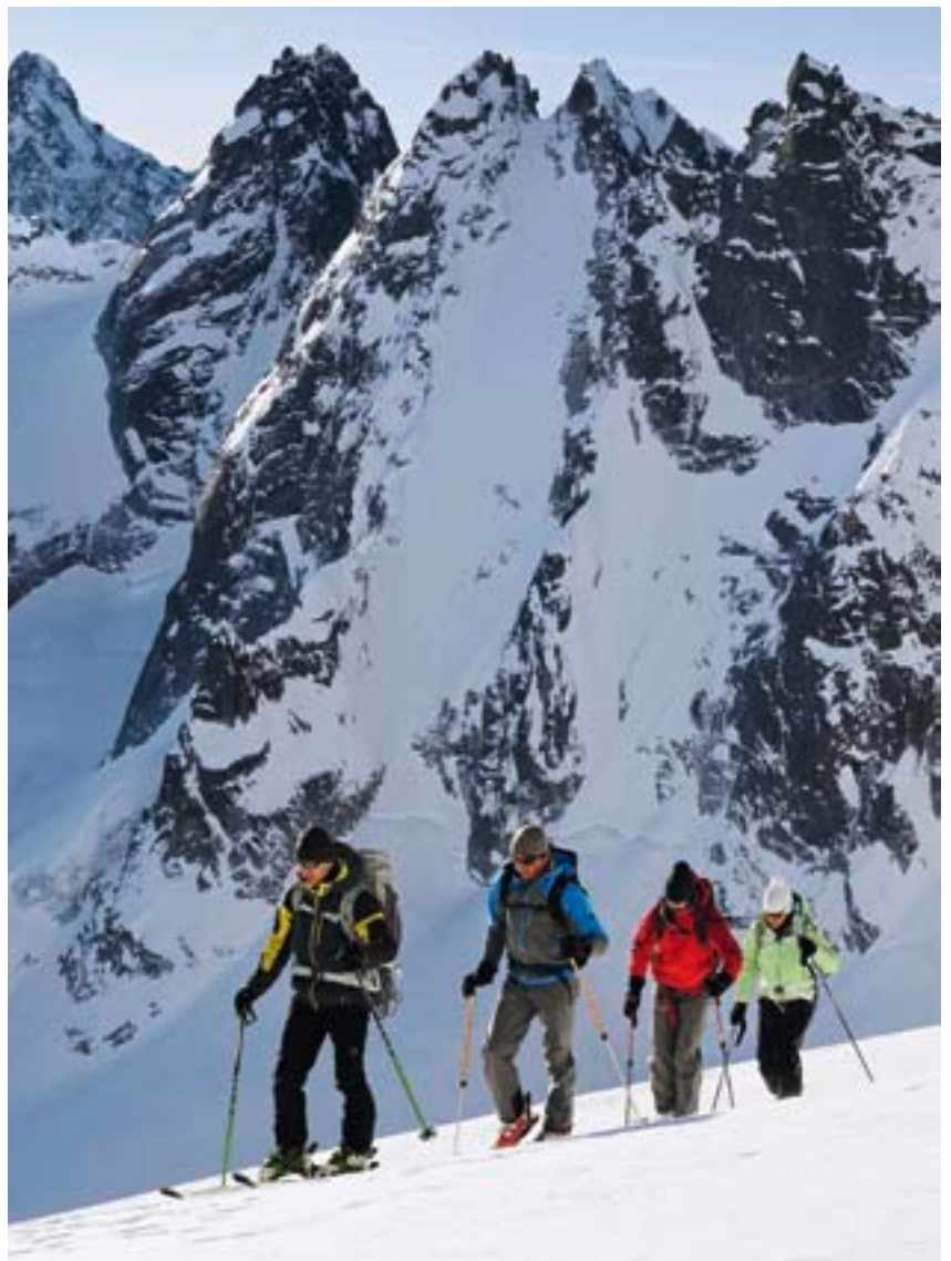
Im Aufstieg zur Cima di Castello. Hinten erheben sich Monte Disgrazia und die Torrone Orientale und Centrale (v.l.n.r.).