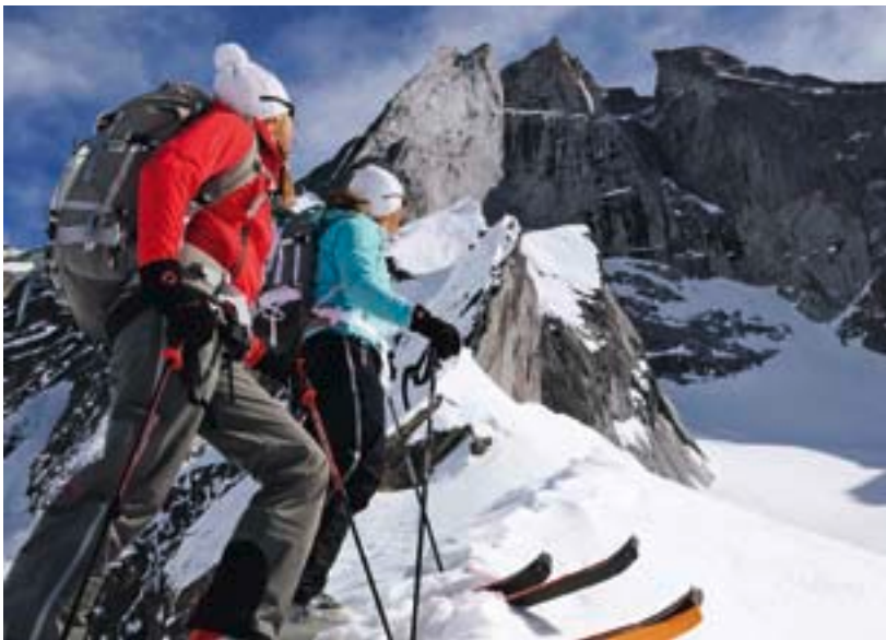
Kurze Aufstiegspause am Fuss der Scioragruppe.