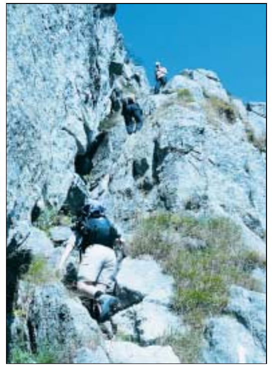
Aufstieg von der Sciora-Hütte Richtung Plota.

tagsschlaf an der Sonne, bevor wir im Abendlicht in die nahe Albigna-Hütte absteigen.