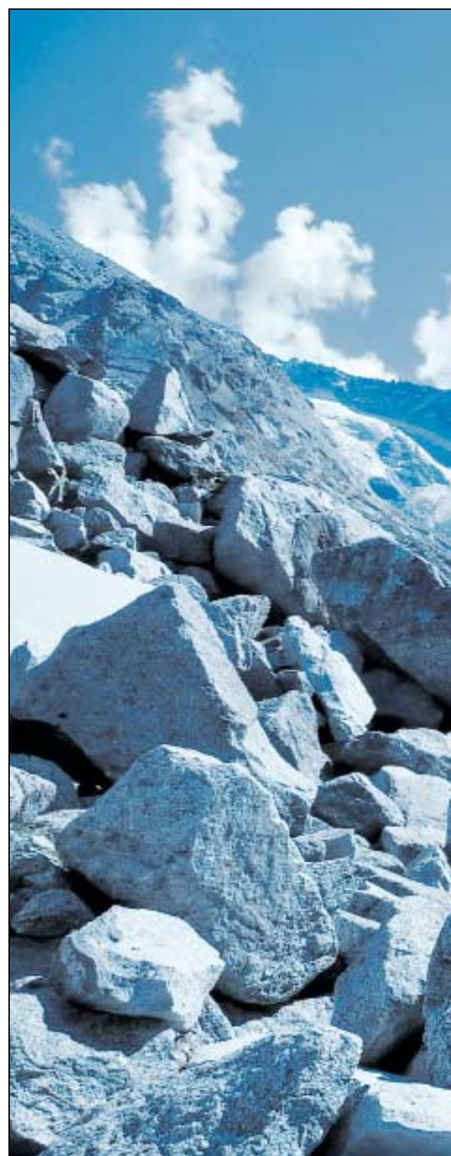
Wanderung für Abenteuerlustige. Oben: Blick auf den Forno-Gletscher. Ganz rechts: Leiter auf dem Weg zum Cacciabella-Pass. Rechts: Forno-Hütte. Unten: Auf der Route von der Sciora-Hütte nach Soglio.

Unterhalb des Casnil-Passes (2941) versperrt uns ein Eisfeld den direkten Zugang zum Pass. Wir halten uns nicht an die Beschreibung im SAC-Führer und bereuen es: Das Eisfeld ist im oberen Teil zu steil, um es ohne Steigeisen zu überwinden. Es ist ratsam, das Eisfeld nordwestlich zu umgehen, auch wenn einen die teils riesigen Felsblöcke zu mühsamen Schritten zwingen. Der Blick vom fast 3000 Meter hohen Casnil-Pass entschädigt für die Strapazen: Endlich ist das Wahrzeichen des Bergells, der berühmte Badile, sichtbar. Über eine Passage mit vielen festen Granitblöcken, die ab und zu einige Kletterfähigkeiten abverlangen, gelangen wir hinunter zu zwei idyllischen Seelein im Osten des Piz dal Päl. Das einfachere Gelände hat uns wieder, wir belohnen uns mit tiefem Mit-